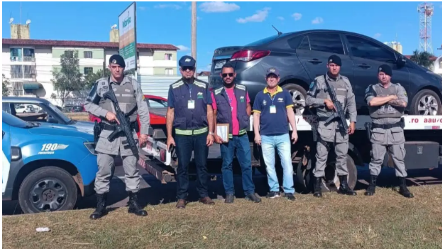
Operação conjunta da Agência Goiana de Regulação (AGR) e Agência Nacional de Transportes Terrestres (ANTT)

Os motoristas não são capacitados e, nem sempre, têm a habilitação necessária para o transporte de passageiros. Além disso, as empresas não oferecem o seguro aos passageiros e, em caso de acidente,