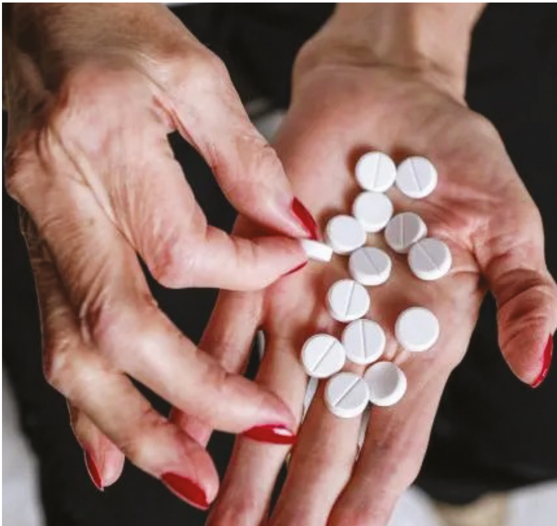
Diclofenaco, nimesulida e ibuprofeno, de grande consumo, têm grande potencial de serem tóxicos aos rins

Mais relacionados aos rins, é possível citar desde o aumento da incidência de cálculos renais – principalmente relacionados ao abuso da vitamina D – até o inchaço das pernas e restabelecimento do corpo, falta de ar, falta de apetite e perda do funcionamento dos rins.