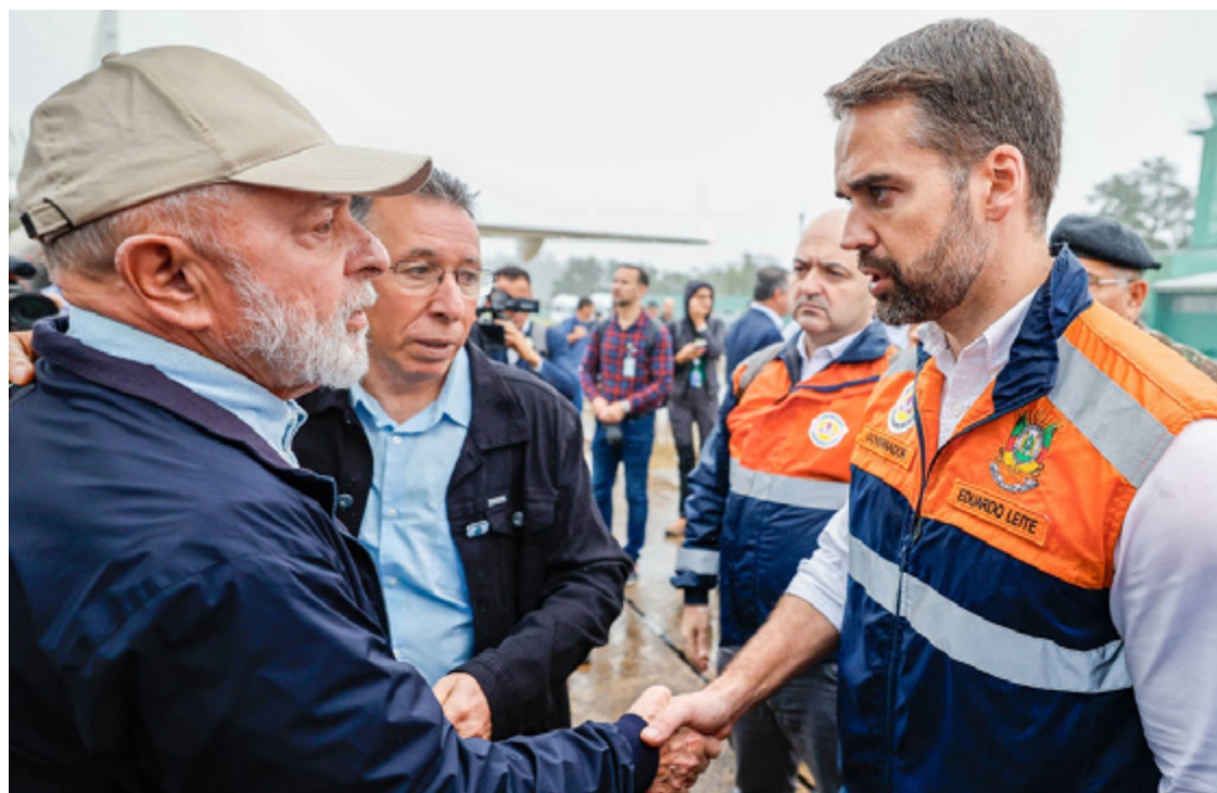
Lula da Silva (PT) e Eduardo Leite (PSDB): desgastes políticos nas ações contra enchente no RS

Embora seja considerada um desafio, a reação à tragédia no Sul também é vista por uma parte do governo como