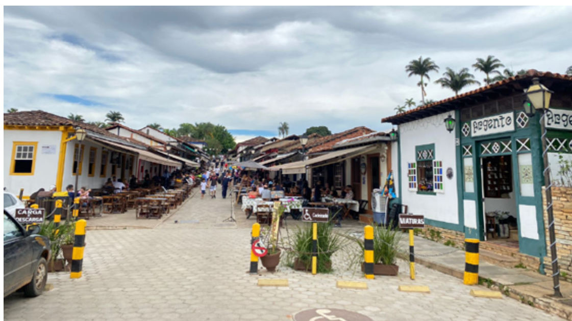
A participação ativa da rede hoteleira é crucial para o sucesso do censo, pois os pesquisadores precisarão do apoio e colaboração dos estabelecimentos durante as visitas

A participação ativa da rede hoteleira é crucial para o sucesso do censo, pois os pesquisadores precisarão do apoio e colaboração dos estabelecimentos durante as visitas.