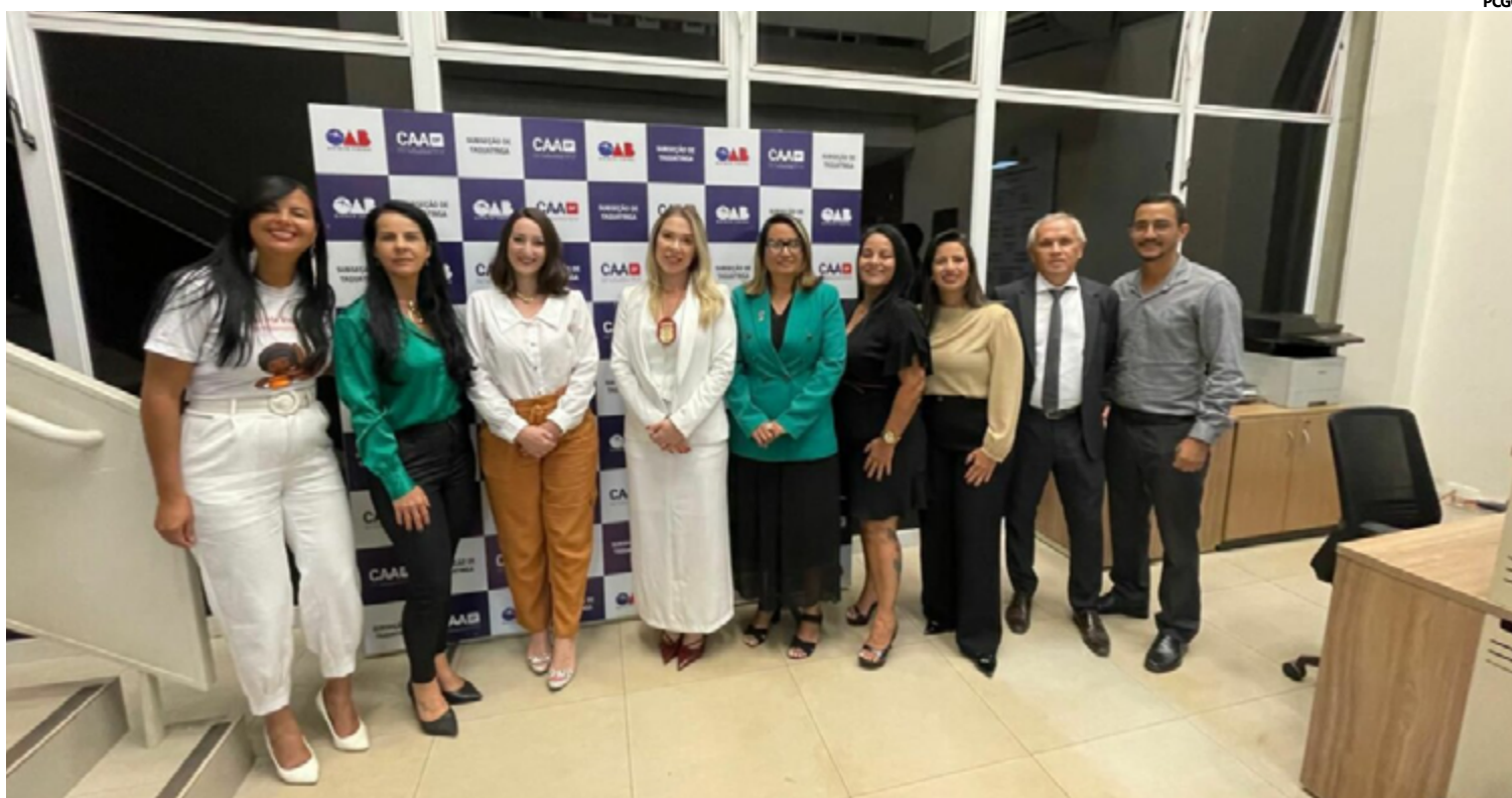
A conscientização e a educação são ferramentas essenciais na luta contra esse tipo de violência

A exploração sexual infantil é uma realidade alarmante que exige uma resposta conjunta e eficaz de toda a sociedade. Profissionais do direito desempenham um papel fundamental na proteção das vítimas e na responsabilização dos agres-