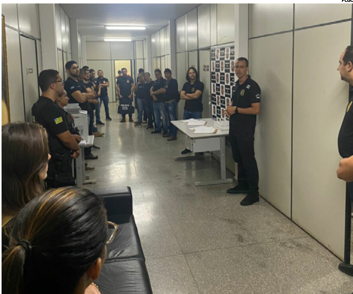
ação conjunta entre o Grupo Especial de Investigações Criminais (GEIC) de Águas Lindas de Goiás e a Delegacia Especializada de Estelionato e Outras Fraudes de Cuiabá (MT)

Diante das evidências, a prisão preventiva foi decretada como medida para evitar novas vítimas do golpe eletrônico praticado pelo suspeito. As autoridades ressaltam a importância de ações conjuntas para combater crimes financeiros e proteger a população contra fraudes eletrônicas cada vez mais sofisticadas.