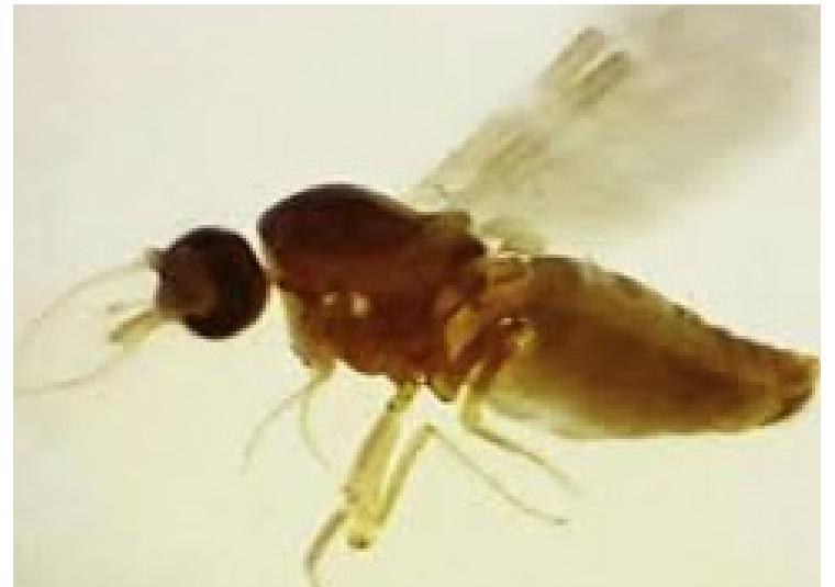
Autoridades saúde já contabilizam, neste momento, 5.102 casos da doença, a maioria na região Norte do país

A maioria dos casos de febre Oropouche no país foi diagnosticada em pessoas com idade entre 20 e 29 anos. As demais faixas etárias mais afetadas pela doença são 30 a 39 anos, 40 a 49 anos e 10 a 19 anos.