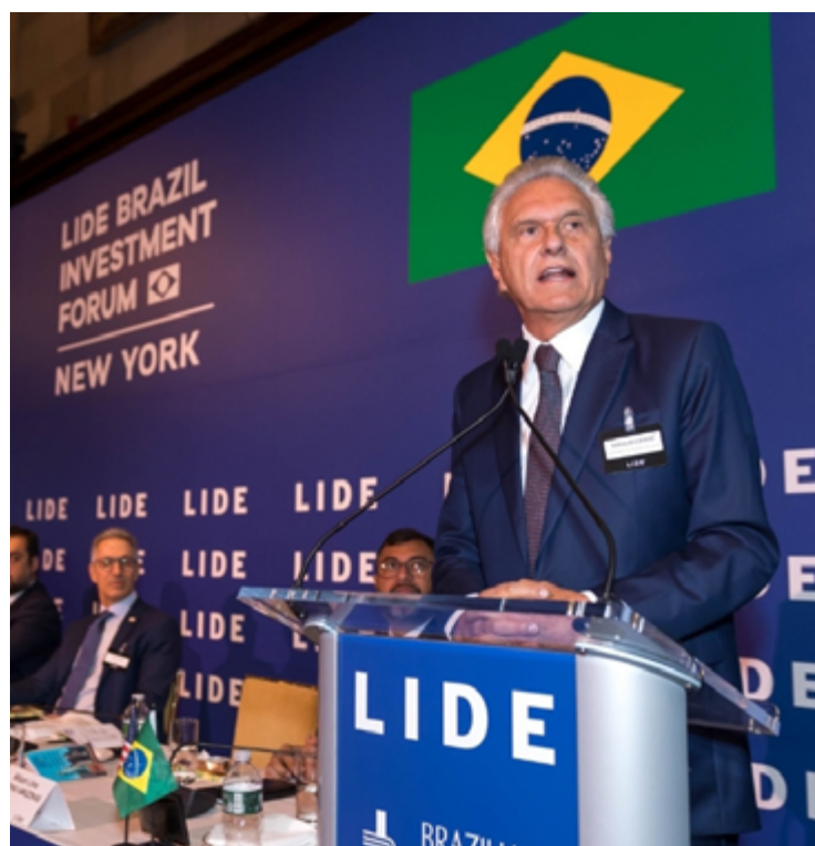
Ronaldo Caiado participou do painel "Opções no Brasil para novos investimentos internacionais": aplaudido por defender os estados

Ronaldo Caiado informou aos empresários que tenta desarticular esse emaranhado de normas confusas responsáveis por bloquear a produtividade, respeitando a legalidade. Para isso procura soluções criativas e políticas públicas responsáveis - caso das ações de responsabilidade fiscal, a criação