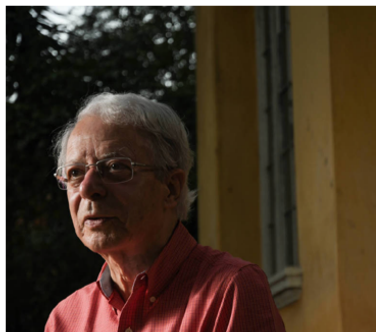
Frei Betto: descompasso do governo Lula 3

“[Problema de] comunicação. Só fiquei sabendo que o Lula estaria lá depois que aconteceu o ato. E eu me considero um sujeito relativamente bem-informado. Além disso, os movimentos em geral estão muito debilitados. E não está havendo ainda uma boa sintonia entre governo federal e movimentos sindicais, populares e pastorais em geral, de todas as religiões. Está faltando uma melhor articulação nesse sentido, mas o governo tem feito muitas coisas e tem avançado”, respondeu Frei Betto.