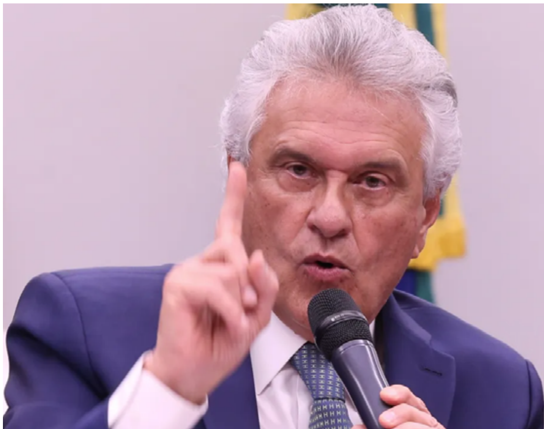
Ronaldo Caiado: defesa da propriedade privada e punições a invasores de terras

Nascido em uma família de produtores rurais que atuam na elite política de Goiás desde o século XVIII e fundador da União Democrática Ruralista