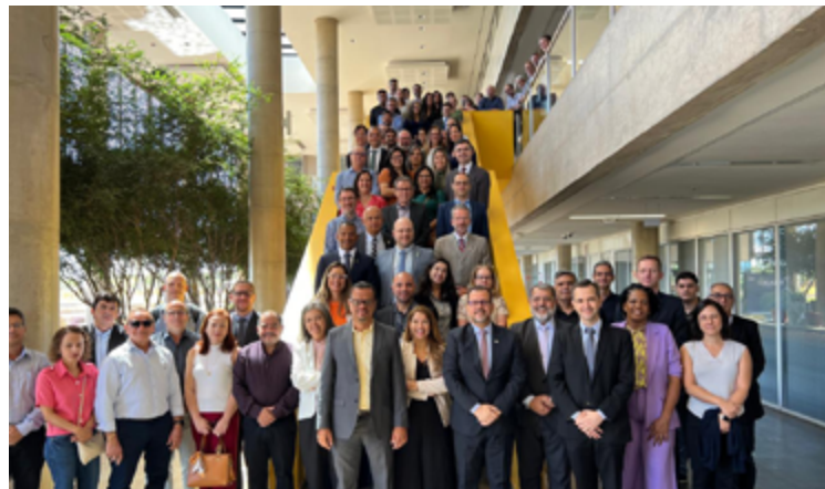
Campanha referente ao "Maio Amarelo" será realizada em unidades estaduais da capital e do interior

Na pauta da reunião foram abordados importantes temas das Finanças Públicas e Contabilidade Aplicada do Setor Público